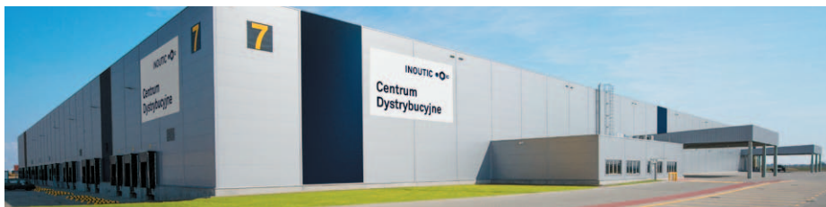
▲ Nové distribuční centrum v polské Poznani

Právě naopak! Český a slovenský trh je nadále naší prioritou. Do obou trhů